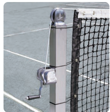
取付イメージ(ネットは別売です)